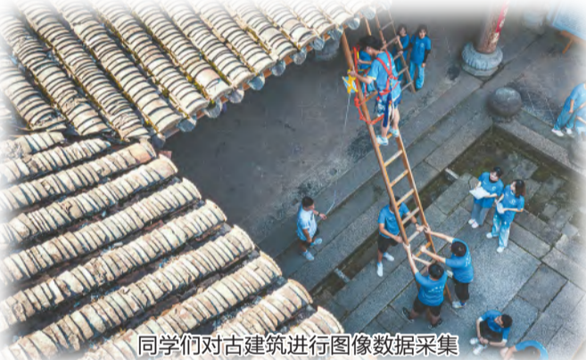
同学们对古建筑进行图像数据采集

据了解，此次古建筑数字化测绘活动，安徽理工大学“倾筑”服务团75名同学分别对查济的宝公祠、洪公祠、德公厅、榴公厅屋、二甲祠、古民居进行了测绘与模型搭建。除了对古建筑进行测绘和数字化处理，“倾筑”服务团还深入查济古村落开展古建筑口述史调研活动，让古建筑真正成为活的文物。